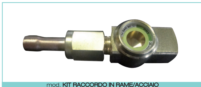
mod. KIT RACCORDO IN RAME/ACCIAIO